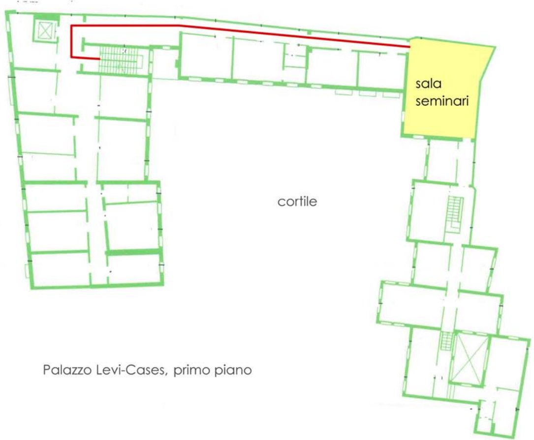
Palazzo Levi-Cases, primo piano